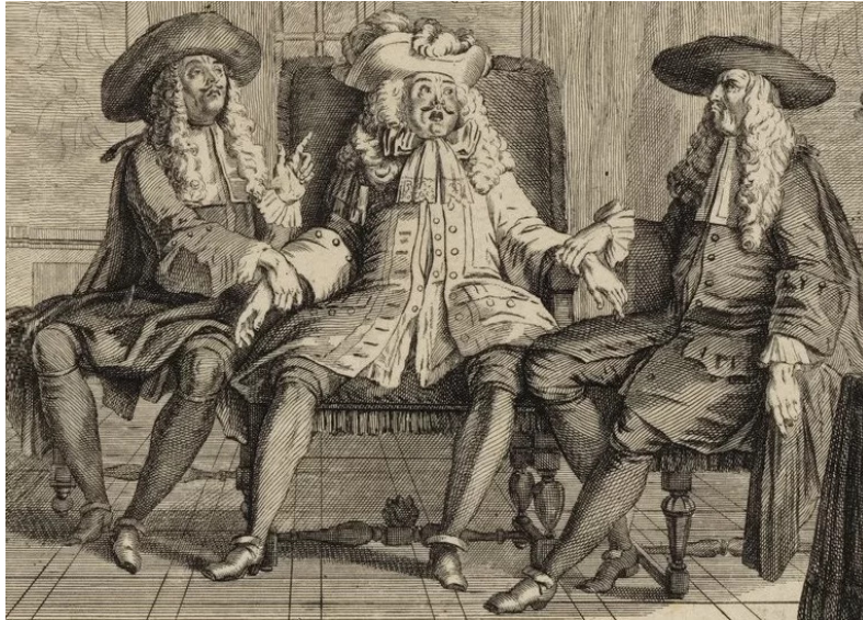
Illustration : Diafoirus père et fils soignant Argan, le malade imaginaire

« Médecins du “malade imaginaire” de Molière, Monsieur Diafoirus et son fils Thomas (“grand benêt nouvellement sorti des écoles, fait toutes choses de mauvaise grâce et à contretemps”), deux cuistres grandiloquents et rétrogrades dont le charlatanisme finit par éclater au grand jour. »