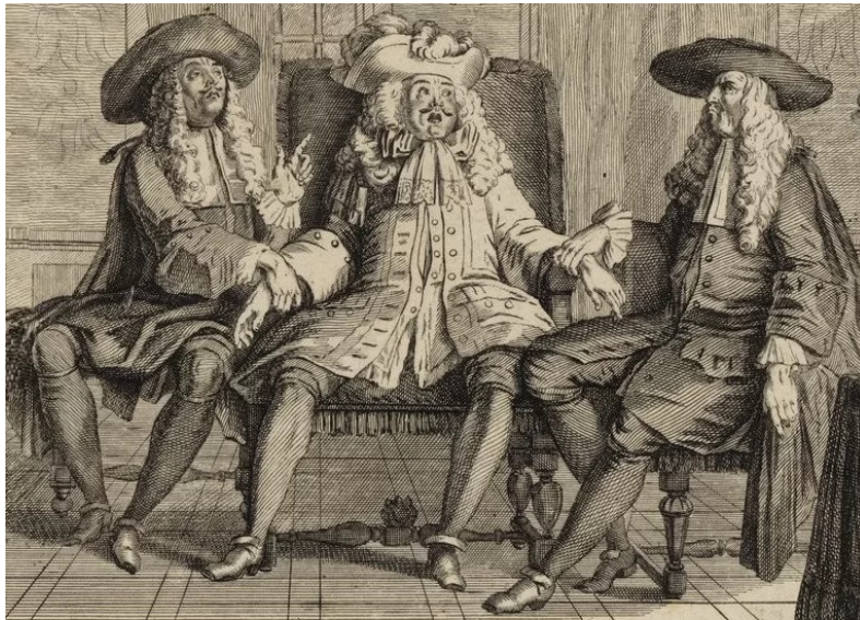
Illustration : Diafoirus père et fils soignant Argan, le malade imaginaire

« Médecins du “malade imaginaire” de Molière, Monsieur Diafoirus et son fils Thomas (“grand benêt nouvellement sorti des écoles, fait toutes choses de mauvaise grâce et à contretemps”), deux cuistres grandiloquents et rétrogrades dont le charlatanisme finit par éclater au grand jour. »