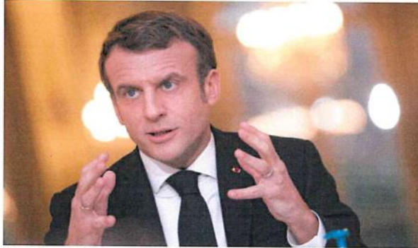
Emmanuel Macron le 4 janvier à Elysee

EXCLUSIF. Le président de la République a répondu pendant un peu plus de deux heures aux questions de sept lecteurs du Parisien-Aujourd'hui en France. Des anti-vaccins au discours de l'extrême droite, en passant par l'écologie et la sécurité, il n'a édulcoré aucun sujet.